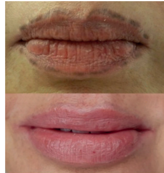
Bilder: Pigmententfernung bei Lippen Ina Bennoun, SC Master Trainer

Die Lippen wurden gelasert und die Pigmente wandelten sich in ein Dunkelgrau bis Braun. Der Laser konnte kein besseres Ergebnis erzielen. Im Gegensatz zur SC-Removal-Technik, die Lippen wurden sanft und schonend gerettet.