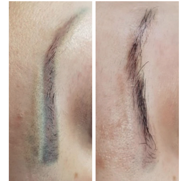
Bilder: Augenbrauen Camouflage-Abdeckung Lolita Vaintraub, SC Trainer

Mit der SC-Removal-Methode lassen sich unansehnliche Permanent Make up- und Microblading-Augenbrauen laserfrei, schonend und ohne Belastung der Haarwurzeln entfernen. Diese Methode ist patentiert und in der europäischen CPNP-Datenbank eingetragen. Hinzu kommt, dass mit SC colorX Farbpigmente vollständig aus der Haut entfernt werden können. SC colorLight bewirkt hingegen durch die niedrig dosierte physiologische Lösung einen Aufhellungseffekt, der eine Korrekturarbeit beispielsweise sehr dunkler Augenbrauen ermöglicht.